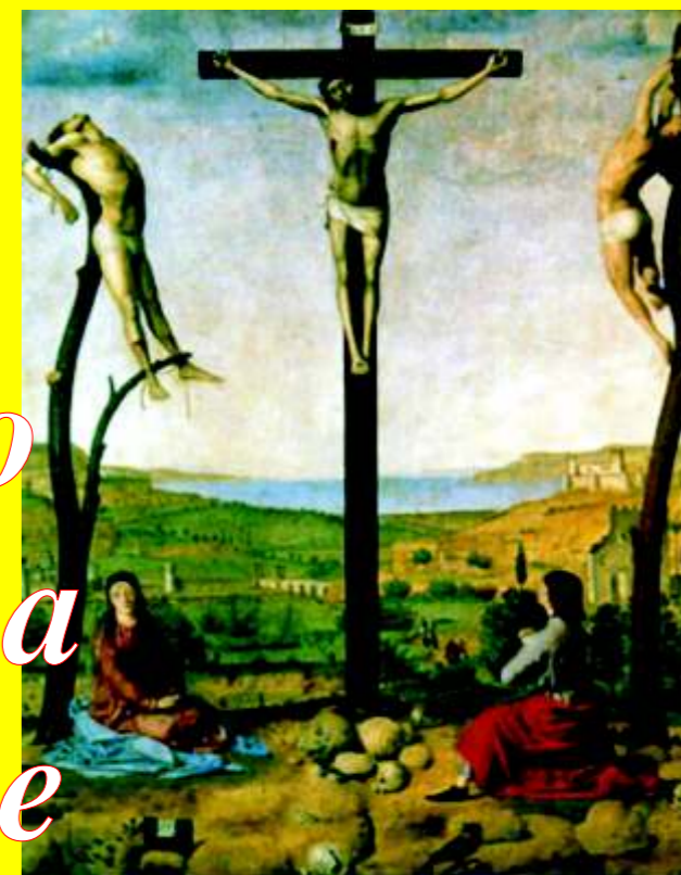
Antonello da Messina: Crocifissione